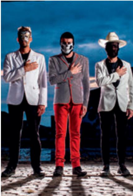
Idiot Saint Crazy Orchestra