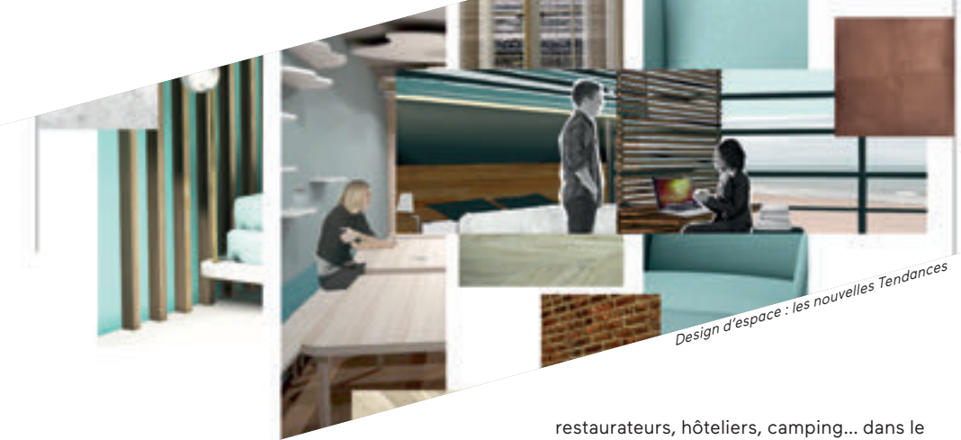
Design d'espace : les nouvelles Tendances