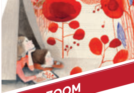
Couverture de l'album Une berceuse en chiffons